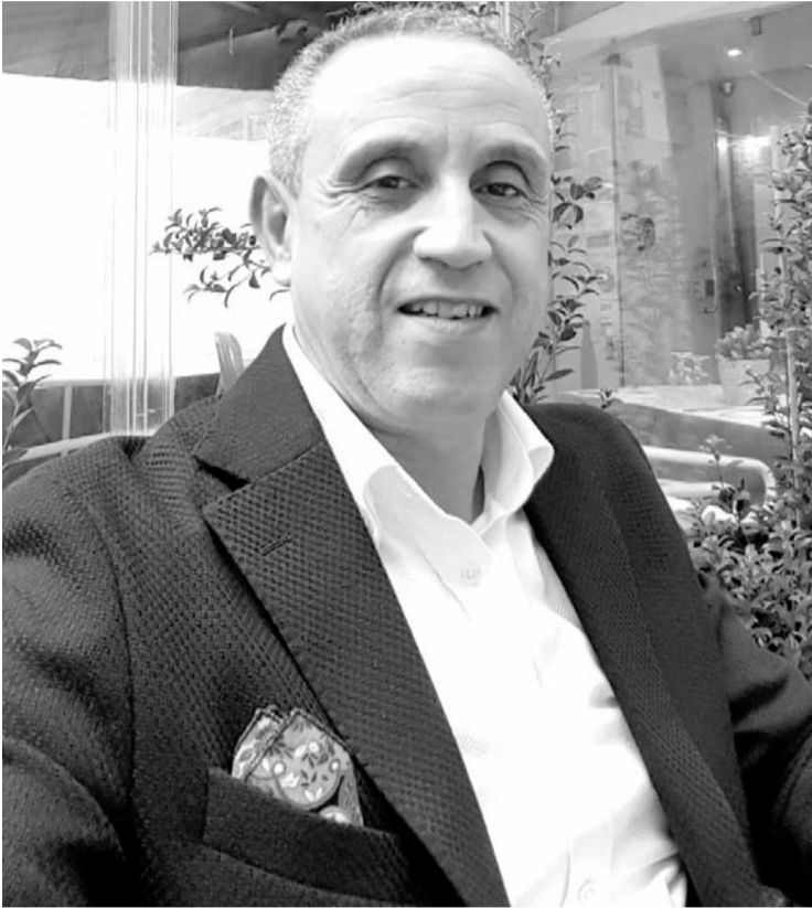
Par D' Arslan Chikhaoui - Expert en Relations Internationales

Le 19 mai 2024, un hélicoptère transportant le président iranien Ebrahim Raïssi, le ministre des Affaires étrangères Hossein Amir-Abdollahian et d'autres responsables s'est écrasé dans les montagnes à la frontière entre l'Iran et l'Azerbaïdjan.