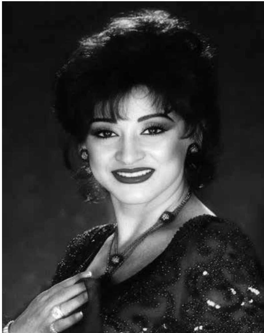
Warda El Djazaïria.