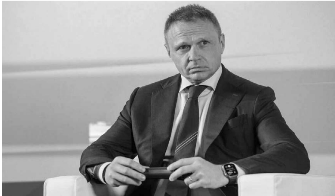
Le ministre italien de l'Agriculture, Francesco Lollobrigida

Dans un communiqué, les services de la Présidence de la République avaient indiqué, le 15 juin dernier, que l'accord de partenariat algéro-italien pour la mise en œuvre d'un vaste projet dans à Timimoune appelé «Fondation Mathi Afrique» s'étendra de 2024 à 2028. En outre, le communiqué ajoute que ce projet «vise à renforcer les relations bilatérales entre l'Algérie et l'Italie à tous les niveaux, ainsi qu'à faire avancer plus rapidement la voie écono-