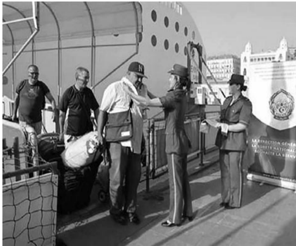
Le Président Tebboune a ordonné lors de la réunion du Conseil des ministres qu'il a prési-

de, lundi dernier, de prendre toutes les mesures nécessaires pour accorder davantage de facilités pour l'accueil des membres de la diaspora algérienne établie à l'étranger pendant la saison estivale. Le président de la République a ordonné au gouvernement de prendre toutes les mesures nécessaires pour accorder davantage de facilités aux enfants de notre communauté, d'autant que nous sommes en saison estivale, a indiqué un communiqué du Conseil des ministres.